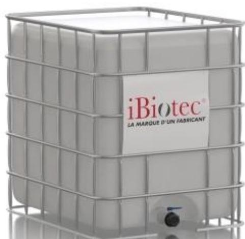
Container IBC 1000 L